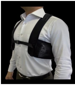
保冷インナー着用例